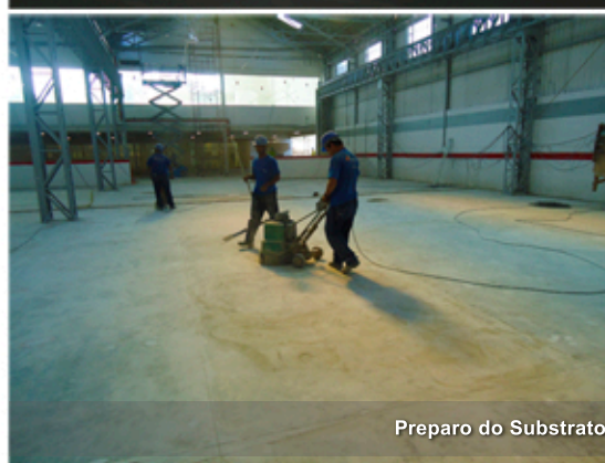
Preparo do Substrato