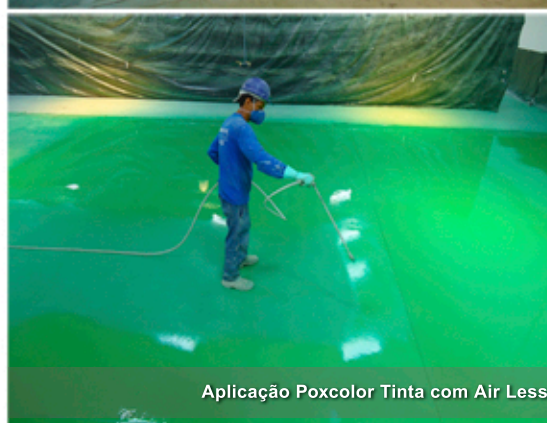
Aplicação Poxcolor Tinta com Air Less